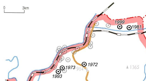
Abb.: Hyesan – IV: Ab 1972 entstandene Dong

Ab 1972 entstanden weitere 5 neue Dong (s. Abbildung).