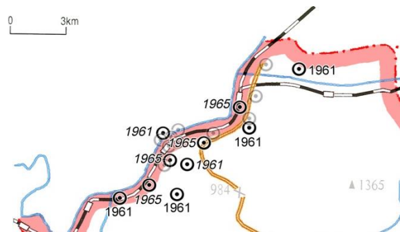
Abb.: Hyesan – III: In den 1960er Jahren entstandene Dong

In den 60er Jahren entstanden 10 neue Dong (s. Abbildung)