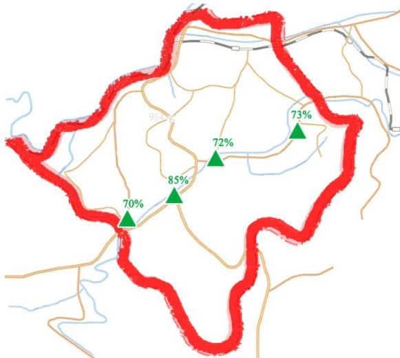
Abb.: Hyesan – I: Anteil der Waldfläche in den vier Ri der Stadt Hyesan

Hyesan liegt „in einer beckenförmigen Weitung des obersten Yalutales, die in ... dünnplattigen grauen Tonschiefern und grauweißen Tuffen ... ausgeräumt worden ist, dicht oberhalb der Einmündung des“ (Lautensach 1945, 229) Höchön-gang. Hyesan liegt in 715 m Höhe und ist damit die höchstgelegene Stadt Nordkoreas (Jong Song Il 2011, 99). Im Nordosten des Stadtgebietes befindet sich eine über 1.000m hohe Hochebene, die von Lavaströmen des Paektusan gebildet wurde, an der Ost- und der Südgrenze des Stadtgebietes ragen hohe Berge hervor und im Westen fließt der Höchön-gang. Ungefähr drei Viertel des Stadtgebietes (74%) aus Bergen bestehen aus Waldland (Yi Ok-hŭi 2011, 160 / IPA-16 2003, 88).