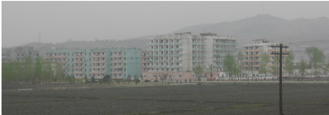
Abb. Jongju-IV: Region westlich des Bahnhofs (2012)