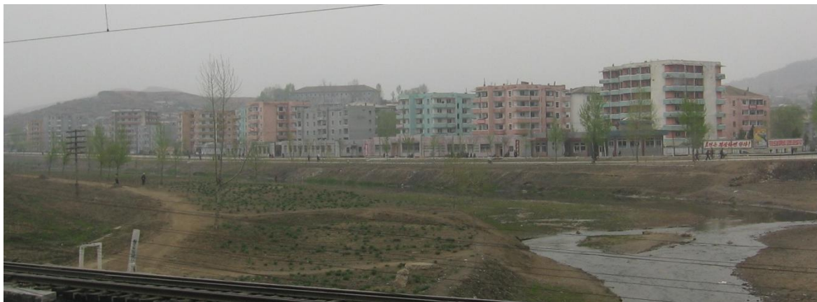
Abb. Jongju-V: Region östlich des Bahnhofs (2012)