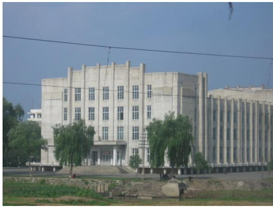
Abb. Jongju-II: Youth Gymnasium (2006)

Das Jongju Youth Gymnasium wurde 1986 eröffnet, hat eine Gesamtfläche von 7,450 m 2 und ist 3-stöckig. Im ersten und zweiten Stock befinden sich die Zuschauerplätze, in der insgesamt 3,500 Menschen Platz haben. Es ist für Reisende eine Art Landmark der Stadt Jongju, da es von Zug aus gut zu sehen ist.