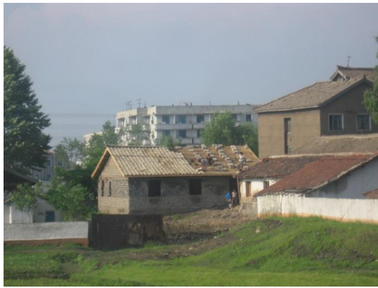
Abb. Jongju-III: Hausbau (2006)