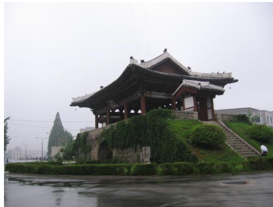
Abb. Kaesong-I: Blick von Janam-dong Abb. Kaesong-II: South Gate auf den Janam-san mit der Kim Il Sung Statue

Vor allem ist Kaesong auch eine Stadt mit großem touristischen Potenzial. Im Jahre 2013 wurden mehrere Sehenswürdigkeiten der Stadt Kaesong als Unesco-Welterbe eingeschrieben