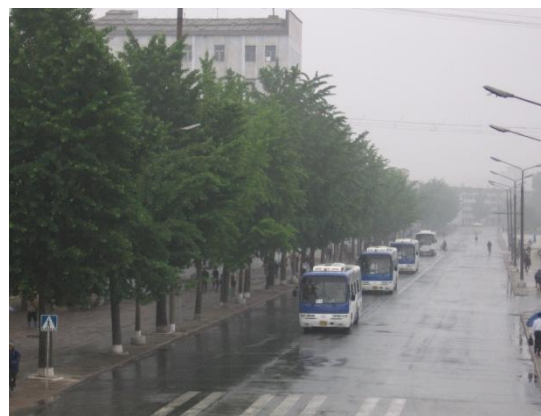
Abb. Kaesong-III: Autobahn von Pyongyang Abb. Kaesong-IV: Fahrt der Arbeiter zur nach Kaesong Kaesong Industrial Region