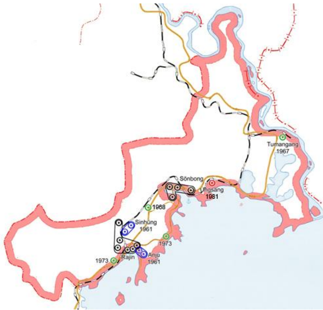
Abb. Rason-I: Dong und ehemalige Arbeiterbezirke